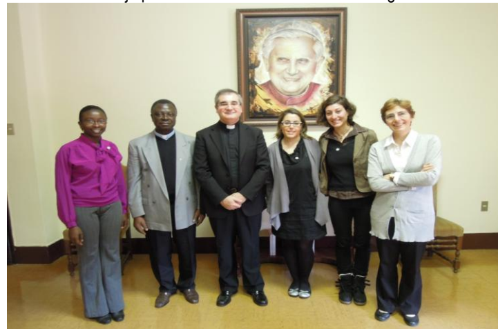
Encuentro con Mgr Delgado, Subsecretario del Pontificio Consejo para los Laicos

Los principales objetivos de estos encuentros eran presentar al nuevo equipo del Secretariado Internacional, compartir los frutos del Congreso Internacional 2012, tenido en Alton, Reino Unido, compartir las diferentes actividades llevadas a cabo por los movimientos nacionales y recibir el programa de actividades de los Pontificios Consejos previamente citados.