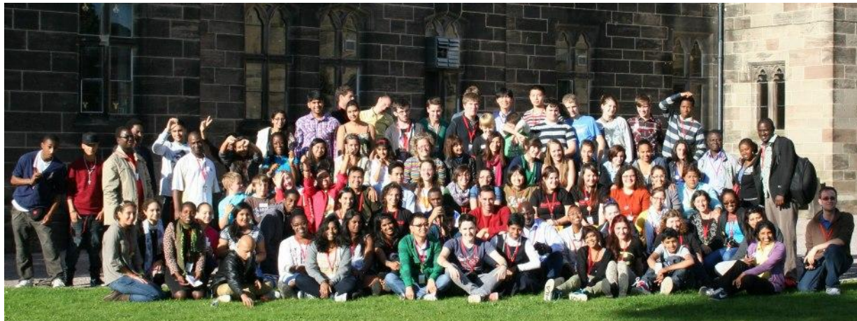
Some of the participants at the 8 th International Congress